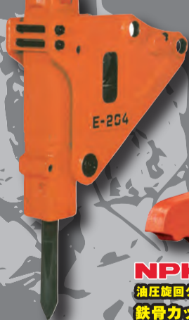
NPK Eシリーズ ブレイカー