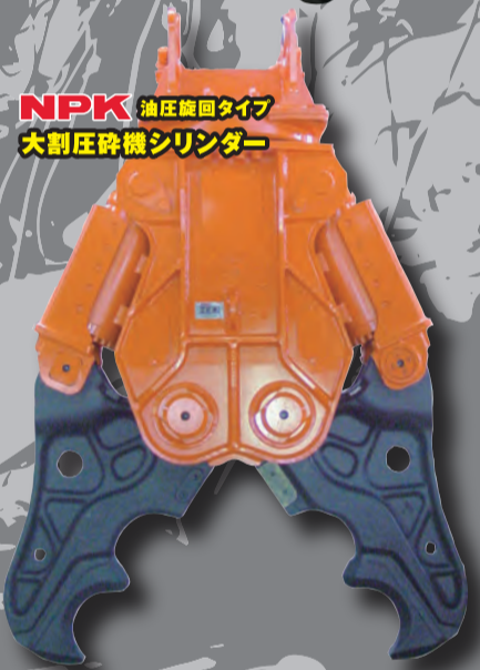
NPK 油圧旋回タイプ 大割圧砕機シリンダー