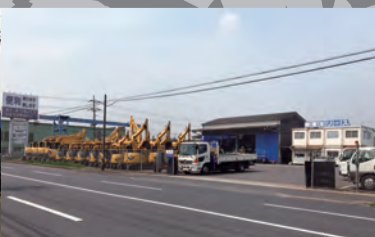
水島営業所 086-456-1588 倉敷市中央6-3-23