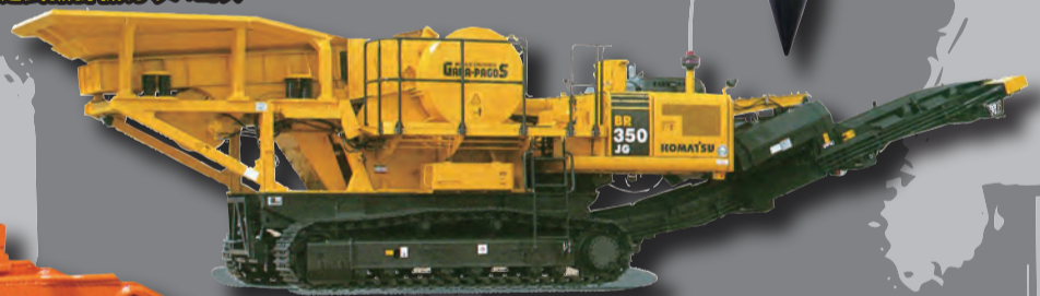
KOMATSU 自走式破砕機ガラバゴス