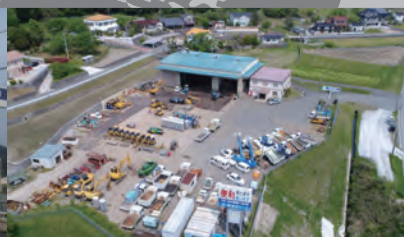
高梁営業所 0866-26-1220 高梁市高倉町田井1370