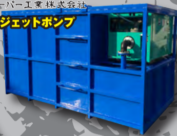
大型ジェットポンプ