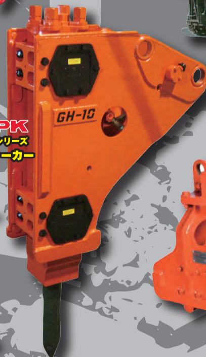
NPK GHシリーズ ブレイカー