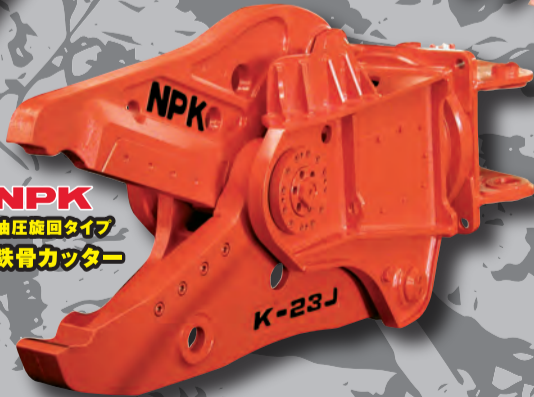
NPK 油圧旋回タイプ 鉄骨カッター