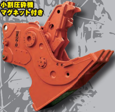
NPK 小割圧砕機 マグネット付き