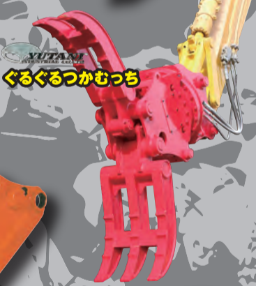
ぐるぐるつかむっち