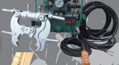
HIRADO 油圧ハンドクラッシャー