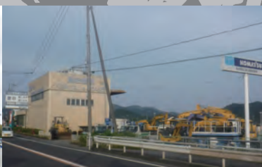
備前営業所 0869-66-7382 瀬戸内市長船町長船1107-1