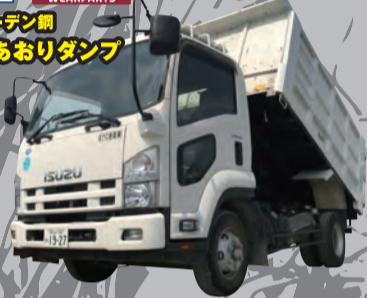
TJK HARDOX WEARPARTS スウェーデン鋼 4t深あおりダンプ