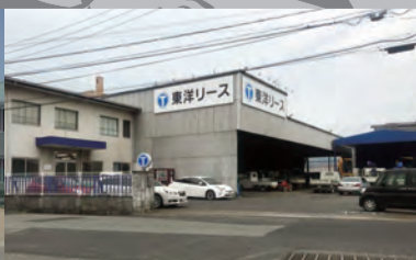
岡山南営業所 086-805-2511 岡山市南区泉田345-1