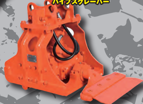
NPK 床面はし機 パイプスクレーパー