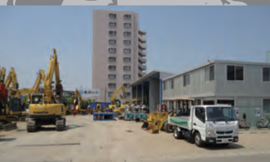
岡山営業所 086-292-6811 岡山市北区蓬来3