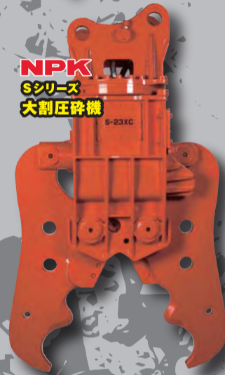
NPK Sシリーズ 大割圧砕機