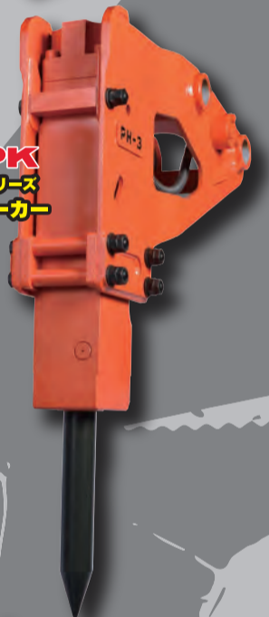
NPK PHシリーズ ブレイカー